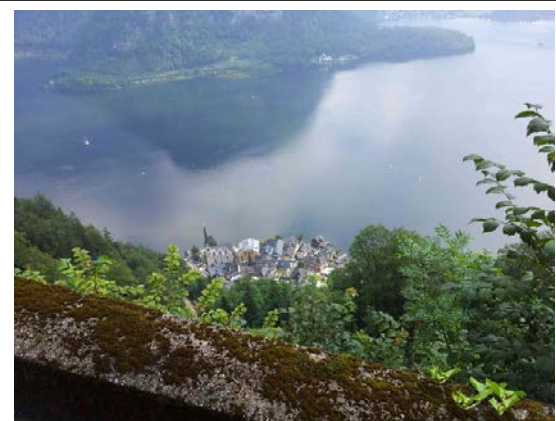
2 Hallstatt am Hallstätter See