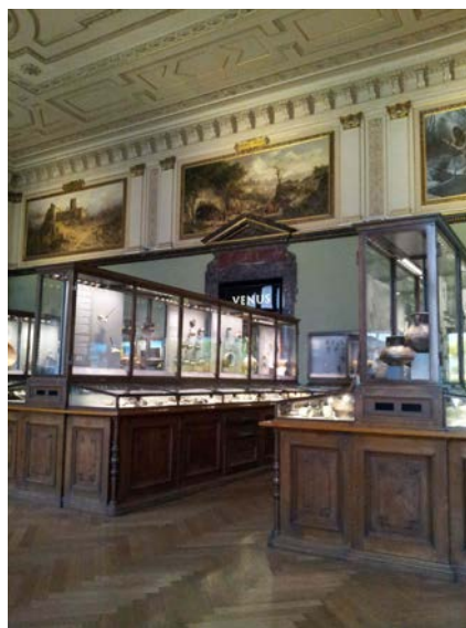
3 Steinzeitsaal - Naturhistorisches Museum Wien