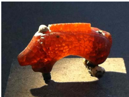
1 Eberfibel aus Bernstein - Gräberfeld Hallein

Die Reise führt aber auch zu den Originalfundplätzen. Hallstatt (UNESCO-Weltkulturerbe) mit seinem prähistorische Salzbergwerk, die zeitlich an Hallstatt anschließenden Bestattungsplätze der frühen Kelten am Dürnberg b. Hallein sowie das nachgebaute Keltendorf Mitterkirchen und schließlich die berühmte Fundstelle von Willendorf im engen Donautal bei Dürnstein stehen auf dem Programm. Ein Ausflug in die romantische Wachau mit dem Städtchen Krems (UNESCO-Weltkulturerbe) an der Donau und zwei Übernachtungen auf einem Weingut runden unsere Entdeckungsfahrt durch Österreich ab. Ein Besuch der unvergleichlichen, weil teilweise wieder aufgebauten Römerstadt Carnuntum mit Österreichs größtem Römermuseum führt uns in die Römische Kaiserzeit.